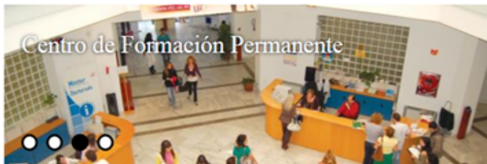
Centro de Formación Permanente